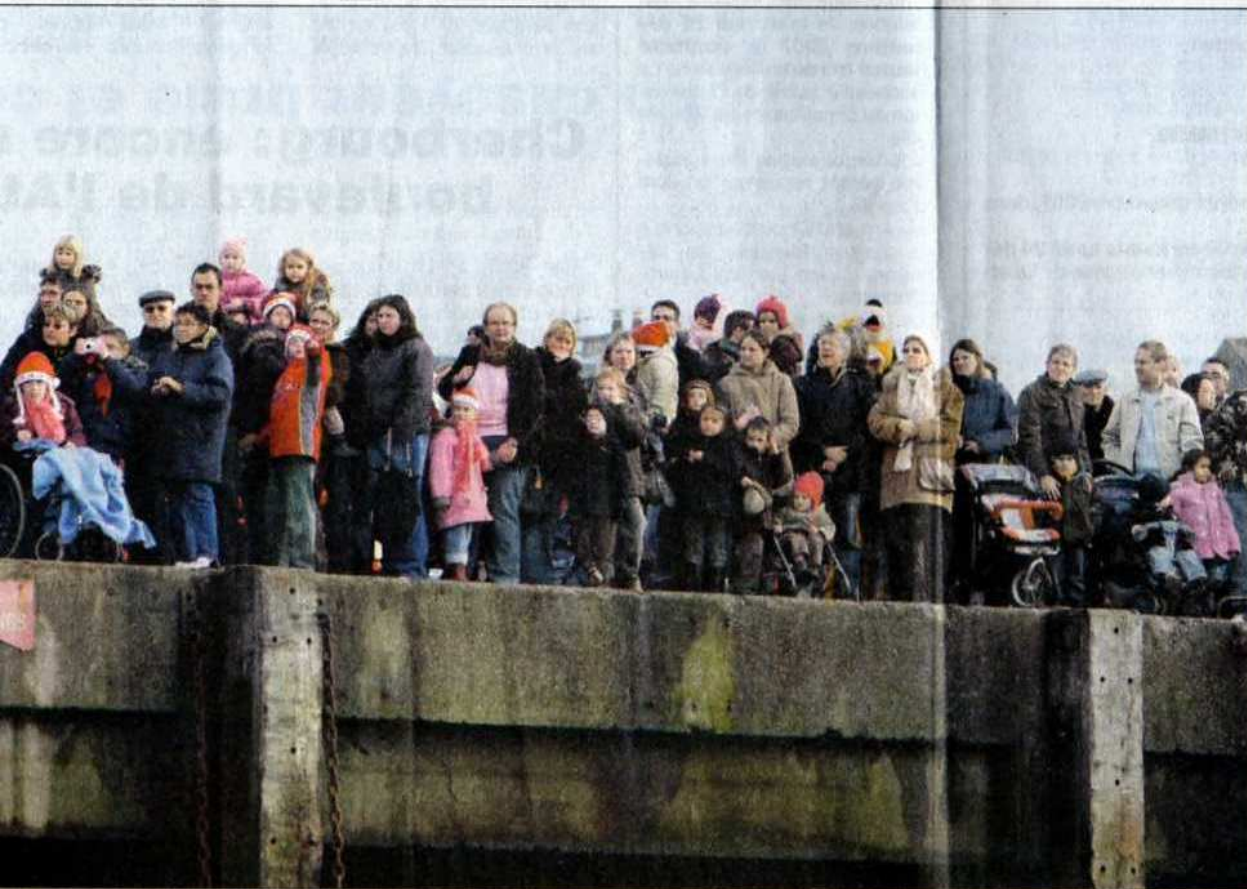
Sur les quais, des milliers d'enfants ont attendu patiemment le Père Noël.