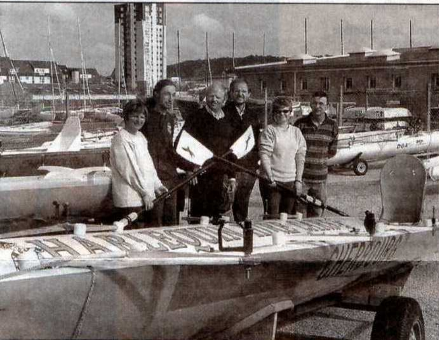
Le parcours du Raid démarre à Saint-Vaast-la-Hougue, passe par Barfleur, le raz de Barfleur, Fermanville, la passe de Collignon, le port de Querqueville, Omonville-la-Rogue, la passe de l'Ouest, la passe de l'Est, le tour de l'île Pelée pour arriver dans l'entrée de l'avant-port.