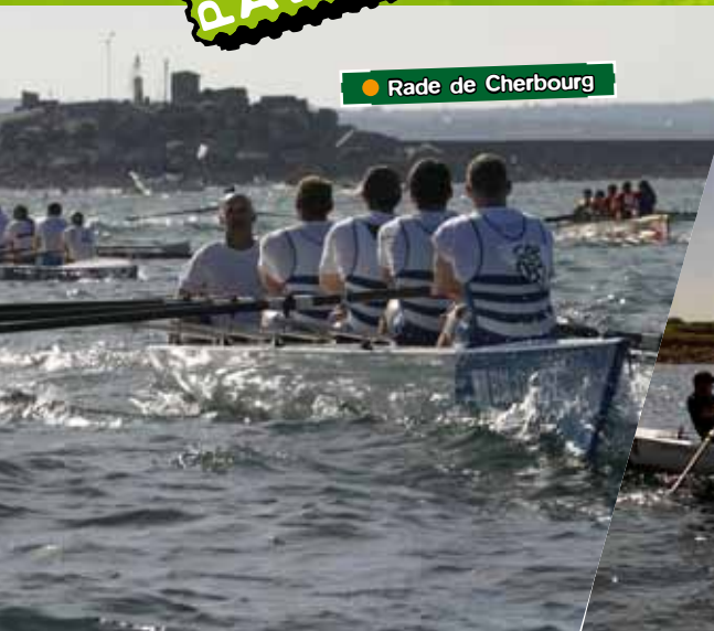
● Rade de Cherbourg