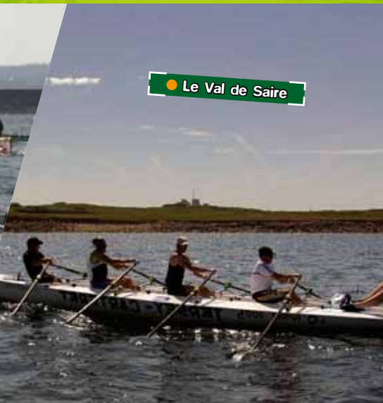
● Le Val de Saire