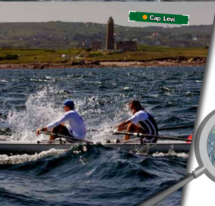
● Cap Lévi